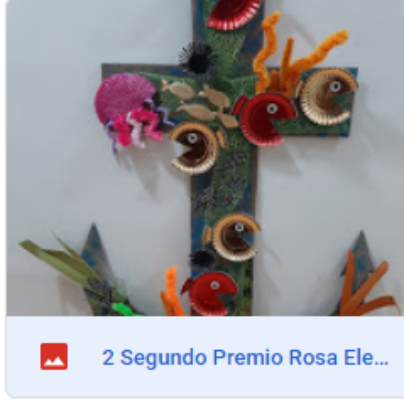
2 Segundo Premio Rosa Ele...