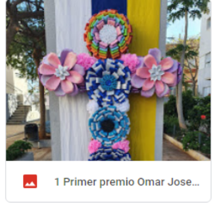
1 Primer premio Omar Jose...

El Ayuntamiento de Santa Cruz de Tenerife, en cumplimiento de lo dispuesto en el artículo 5.º de la Ley Orgánica 15/1999 de Protección de Datos de Carácter Personal, le informamos que sus datos de carácter personal serán incorporados a un fichero de carácter personal denominado CIUDADANOS del que es responsable el Organismo Autónomo de Fiestas y Actividades Recreativas. El OAFAR tiene implantadas las medidas de índole técnica y organizativas necesarias para garantizar la seguridad, confidencialidad e integridad de los datos de carácter personal que trata. Sus datos no serán cedidos a terceros sin que conste expresamente su consentimiento, salvo aquellos supuestos legalmente establecidos. Igualmente sus datos no se destinarán a fines distintos de aquéllos para los que han sido recabados. Finalizadas las gestiones administrativas, serán cancelados en las condiciones establecidas en la legislación vigente. Por último le informamos de que puede ejercitar los derechos de acceso, rectificación, cancelación, oposición y limitación de tratamientos en los términos previstos en la Ley Orgánica 15/99 y normativa de desarrollo y por los procedimientos definidos al efecto por el OAFAR.